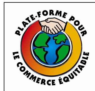
Plate-Forme pour le Commerce Equitable 61 rue de la Chapelle 75018 Paris plate-forme@commerceequitable.org